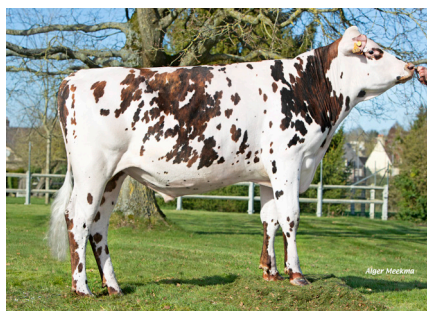
RILEY JET (Octavius)